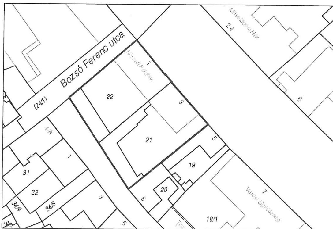
1. ábra: Térképszelvény (21 hrsz., 22. hrsz.)