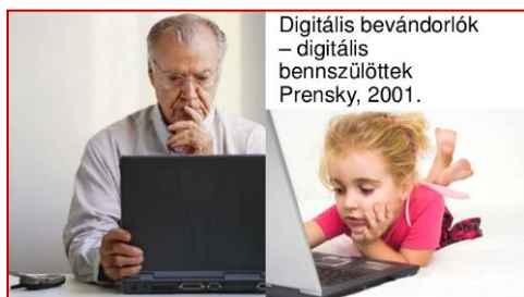
Digitális bevándorlók – digitális bennszülöttek Prensky, 2001.

Akár tetszik ez nekünk, felnőtteknek – akik sokszor digitális bevándorlóként tengődünk a gyerekeink mellett, akik viszont a digitális világ bennszülöttei –, akár nem.