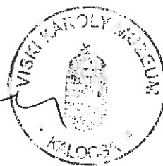
Romsics Imre múzeumigazgató