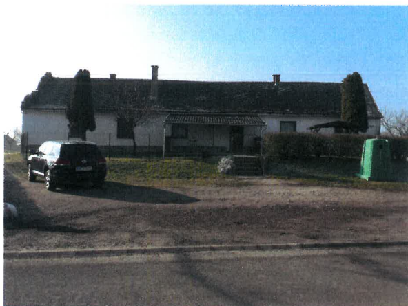
Kalocsa, Nagy u. 45. és a közút közötti értékelt közterület