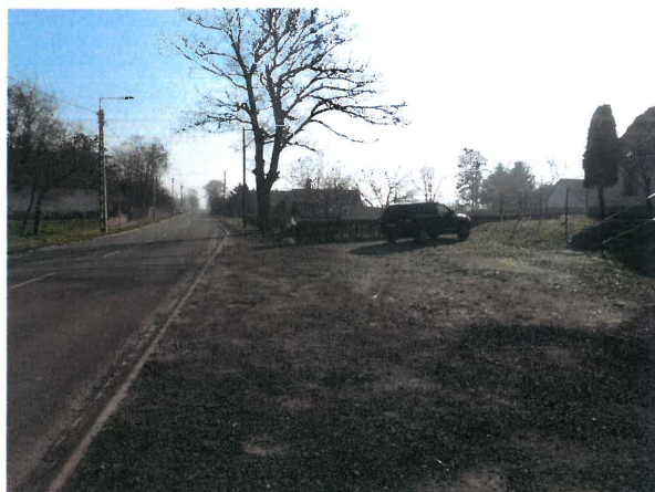
Értékelt közterület a közúttal