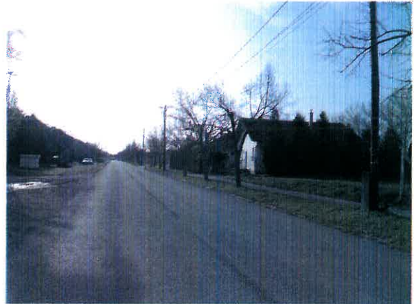
Ingatlan előtti út, Paksi köz