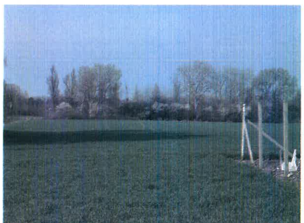
Ingatlan területe az árpaültetvénnel