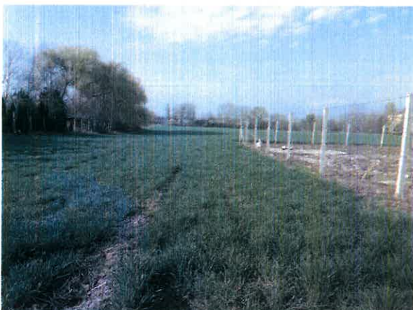
Ingatlan területe az árpaültetvénnel