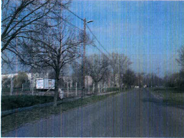
Ingatlan előtti út, Paksi köz