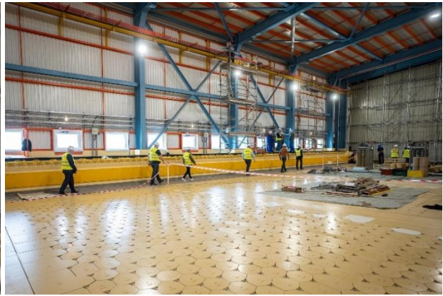
A bizottság tagjai a KKÁT beruházási területén május 16-án

A beszámolási időszak számunkra kiemelkedő eseménye volt az idei TEIT Nap megrendezése, amely során lehetősége nyílik a társulásnak a bemutatkozásra a települések irányába, lehetőségünk van a közvetlen párbeszédre, mind a települések között, mind a nukleáris partnerek irányába. Az előadások keretében lehetőséget kapnak a települések résztvevői, hogy a legfrissebb információkat szerezzék meg akár közvetlen kérdések felvetésével is. Az előadások során képet kaphattunk az RHK Kft. aktualitásairól, a Paks II. építkezés jelenlegi fázisáról, és az MVM Paksi Atomerőmű Zrt. tervezett üzemidőhosszabbításáról. Az előadások ideje alatt a gyermekek részére szakmai és sportos vetélkedőt szerveztünk a dunaszentbenedeki pedagógusok segítségével. A programot közös ebéd zárta a faluházban.