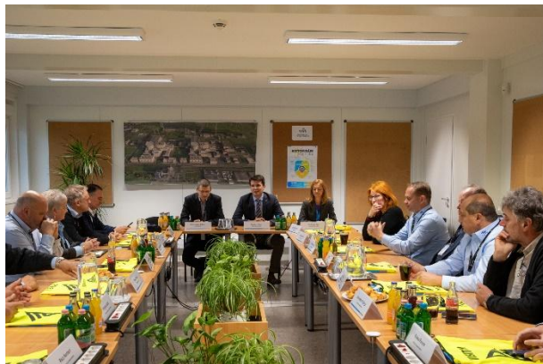
A társulás képviselői 2024. 11. 12-én Pakson

Az év folyamán teljesítettük összes szerződéses kötelezettségünket 5 lapszám került kiadása a kiadványunkból (1. számú melléklet), amely a társulás minden háztartásába eljutott.