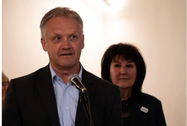
A vetélkedő 2024. április 23-án Kalocsán

A beszámolási időszak talál legfontosabb eseménye számunkra – amelynek a KNPA alaptól származó támogatásra csekély hatása van – a Tomori Pál híd elkészülte és átadása volt. Társulásunk 8 települése a Duna bal partján, 8 települése a jobb partján fekszik, ennek okán a 20. magyarországi Dunai-híd átadása a települések közötti közvetlen összeköttetést jelenti.