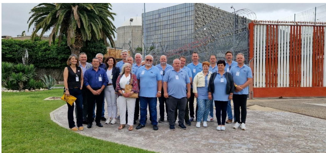
A tanulmányi út résztvevői a fogadó féllel Almarazban

Másodikként a beszámolási időszakban tartotta meg a társulás éves tanulmányi útját, amelyek fő célja a külföldi tapasztalatszerzés, a jó gyakorlatok megismerése és a hazai tevékenységgel történő összehasonlítás volt, az út költségeit nem számolja el a társulás a Központi Nukleáris Pénzügyi Alap irányába, azonban a szerzett tapasztalatok nagymértékben hozzájárulnak a társulás tagjainak tapasztalatszerzéséhez, a nukleáris ipar jelenlegi trendjeinek követéséhez és egy leszerelés előtt álló atomerőmű hozadékainak, és hátrányainak megismeréséhez. 2024. június 18-án a TEIT delegációja (12 településvezető és 3 fő szakmai kísérő) ellátogatott a spanyolországi Almaraz településen lévő atomerőműbe. A kiválasztásban segítséget nyújtott a spanyol AMAC szervezet, amely az RHK Kft.-hez hasonló szerepet tölt be Spanyolországban a nukleáris iparban.