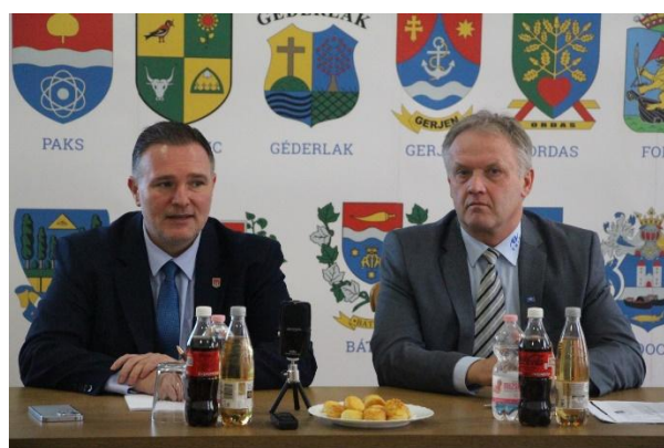
A társulás tagjai 2024. február 7-én Foktőn, a társulás tagjai 2024. május 24-én Géderlakon, valamint 2024. október 15-én és 2024. december 5-én Kalocsán