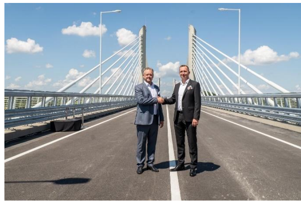
A TEIT képviselői a híd átadásán

Társulásunk kiemelt figyelmet fordít az épülő paksi új blokkokkal kapcsolatos folyamatos tapasztalatszerzésre, ezért idén év végén is helyszíni tájékozódással tekintettük meg a térség számára kiemelkedő jelentőségű beruházást. A látogatás során a projektcég vezetőitől közvetlen információkat szerezhetett a társulás, és meggyőződött a beruházás előrehaladásáról.