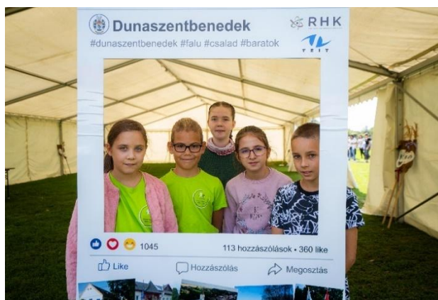
A TEIT Nap képei 2024. szeptember 20-án

Térségi programokat támogatva, együttműködtünk az ÖKO munkacsoport „Zöld Környezetben” elnevezésű vetélkedőjében, ahol több TEIT tagtelepülés csapata is volt a résztvevők között. A többfordulós rendezvény döntőjére idén Kalocsán került sor, ahol a TEIT ajándékokkal, vendéglátással kedveskedve, valamint két zsűritagot biztosítva vette ki a részét a nagysikerű rendezvényből.