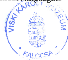
Romsics Imre múzeumigazgató