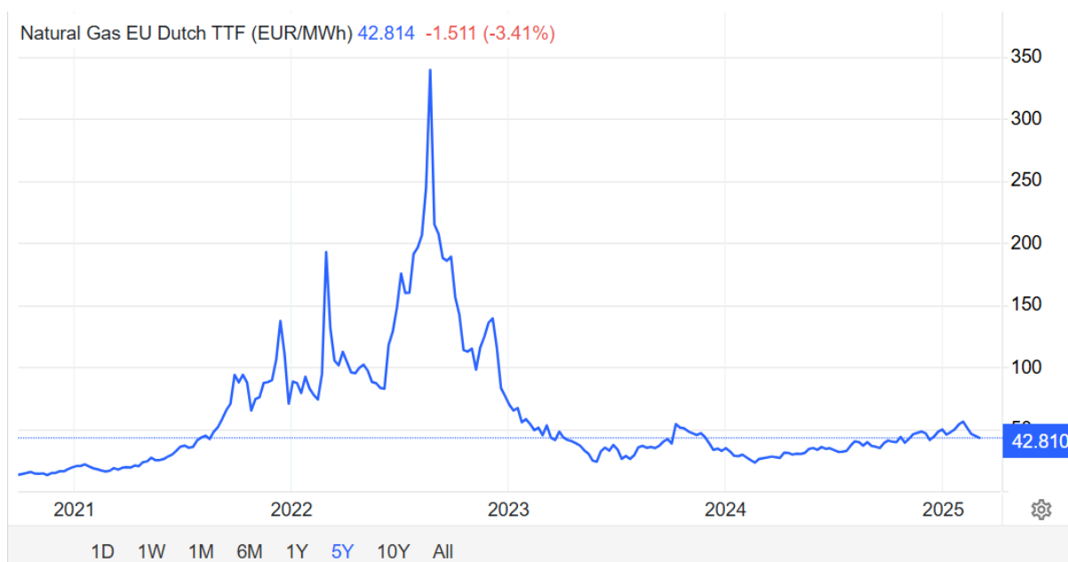
2. ábra: Földgáz árának alakulása a holland TTF árutőzsde indexének alapján

A Magyar Kormány 2022. júliusában kormányhatározat keretében vette ki az önkormányzatokat a rezsicsökkentés hatálya alól, melynek értelmében azóta csak piaci áron tud Kalocsa város önkormányzata földgázt és villamos energiát vásárolni. Ez a gyakorlatban az előbbi termékkategória esetében közel tízszeres (2. ábra), utóbbinál pedig több mint kétszeres kiadás növekedést jelentett. A drasztikus áremelkedés miatt az önkormányzat kénytelen volt az önként vállalt feladatait jelentős részben átalakítani. Többek között emiatt került bezárásra a Kalocsai Uszoda és Gyógyfürdő. Gyakorlatilag minden, az óvodák és bölcsőde, valamint a szociális intézmények fűtésén kívüli önkormányzati ingatlan rezsiköltségén igyekezett a város spórolni. Ez az ingatlangazdálkodás vonatkozásában jelentős változást hozott – számos épület állaga leromlott, idővel használhatatlanná vált.